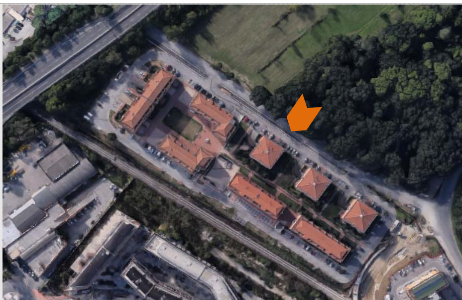
Riferimenti Fotografici dell'immobile: