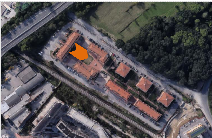
Riferimenti Fotografici dell'immobile: